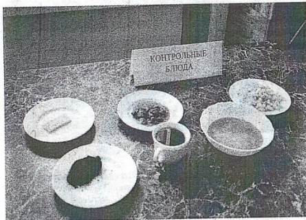
Питание для детей готовится из свежих и качественных продуктов.